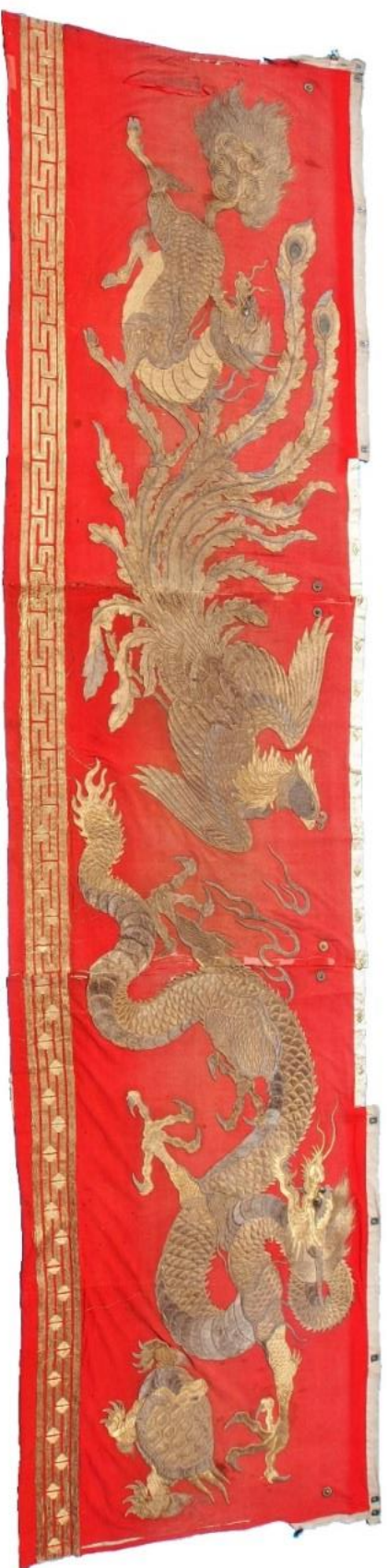
向かって左側より、麒麟・鳳凰・応龍・靈龜